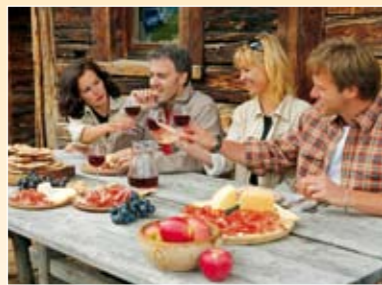
Bergwanderung Escursione in montagna