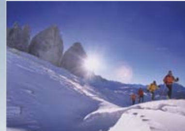
Schneeschuhwanderung zu den Drei Zinnen Con le racchette da neve verso le Tre Cime di Lavaredo