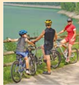
Fahrradausflug Escursioni in bicicletta