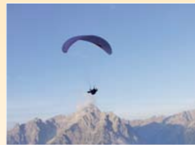
Tandemflug nach Sonnenaufgang Volo biposto con il parapendio dopo l'alba