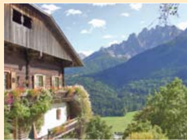
Unser Bauernhof Il nostro maso