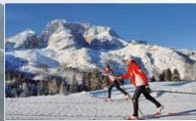
Langlaufen im Hochpustertal Sci da fondo in Alta Pusteria